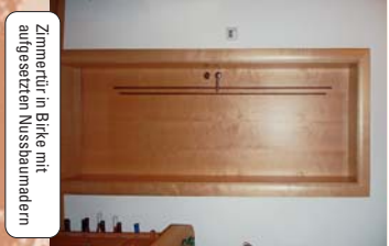
Zimmertür in Birke mit aufgesetztem Nussbaumadern