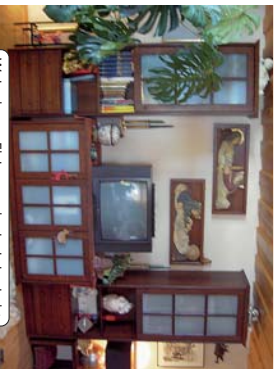
Wohnzimmer Eiche massiv, dunkel gebeizt