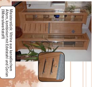
Meisterstück: Vitrine aus kanadischem Ahorn, kombiniert mit Edelstahl und Corian (Mineralkeramikstoff)