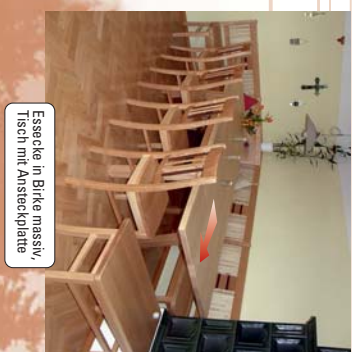
Esstische in Birke massiv, Tisch mit Ansteckplatte