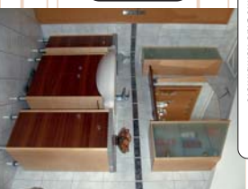
Badmöbel Ahorn/Nussbaum mit Glas kombiniert