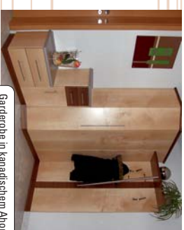
Gartentruhe in kanadischem Ahorn, kombiniert mit Nussbaum