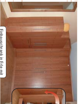
Einbauschränk in Eiche mit praktischen Kleiderhütten