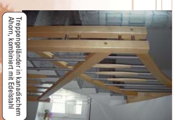
Treppengeländer in kanadischem Ahorn, kombiniert mit Edelstahl