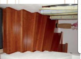
belagte Treppe aus amerikanschem Kirschbaum