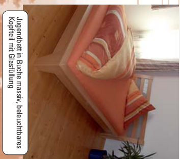
Jugendbett in Buche massiv, beleuchtbares Kopfteil mit Glasfüllung