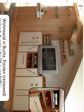
Wohnwand in Buche, Fronten cremefarben lackiert, Ausszüge für CD's und DVD's