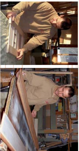
Holz ist ein lebendiger Werkstoff, dessen Bearbeitung einiges an Erfahrung benötigt. Wir achten schon beim Einkauf unserer Rohstoffe und Materialien auf Qualität.