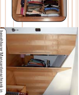
begehbare Mansardenschränk in Ahorn, millimetergenau eingepasst