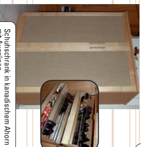
Schuhschrank in kanadischem Ahorn mit Auszügen