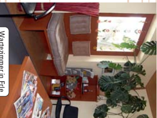
Wartezimmer in Erla

Praxiseinrichtungen - Komplettlösungen aus Meisterhand. Neubau, Umbau und Altbausanierung - wir bieten Ihnen Schreinerleistungen auf höchstem Niveau, fragen Sie uns, wir beraten Sie gerne.